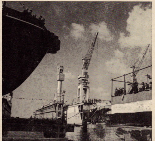
Varo del rimorchiatore «Vincio Barretta» (dicembre 1986)

COSTRUZIONI E RIPARAZIONI NAVALI E MECCANICHE SHIPBUILDING AND REPAIRING YARD